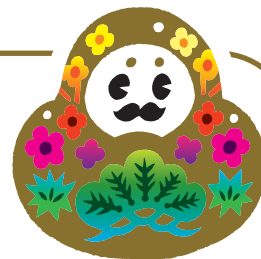
石川県観光PRマスコットキャラクター 「ひやくまんさん」

We take preventive measures against COVID-19.