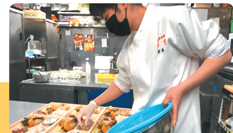
支援事例 2 豪華弁当で活路

ディスプレイの専門家を派遣して、商品にかける思い やコンセプトが伝わる、「買いたくなる」見せ方を提案。