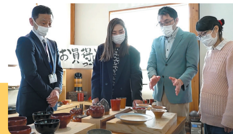
支援事例 1 魅力的な店舗づくり

ディスプレイの専門家を派遣して、商品にかける思い やコンセプトが伝わる、「買いたくなる」見せ方を提案。